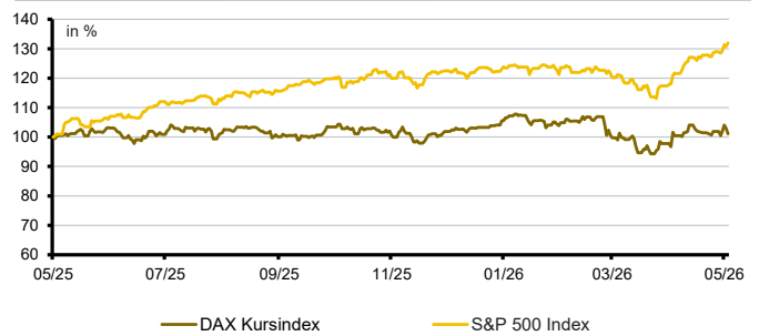
Aktien aktuell*: DAX Kursindex versus S&P500 Index

*Datenquelle der Grafik: Bloomberg; Darstellung von 12 Kalendermonaten; Entwicklung in lokaler Währung