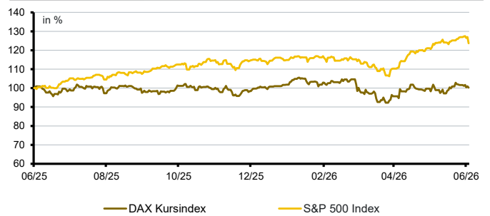
Aktien aktuell*: DAX Kursindex versus S&P500 Index

*Datenquelle der Grafik: Bloomberg; Darstellung von 12 Kalendermonaten; Entwicklung in lokaler Währung