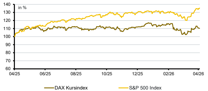
Aktien aktuell*: DAX Kursindex versus S&P500 Index

*Darstellung von 12 Kalendermonaten; Entwicklung in lokaler Währung