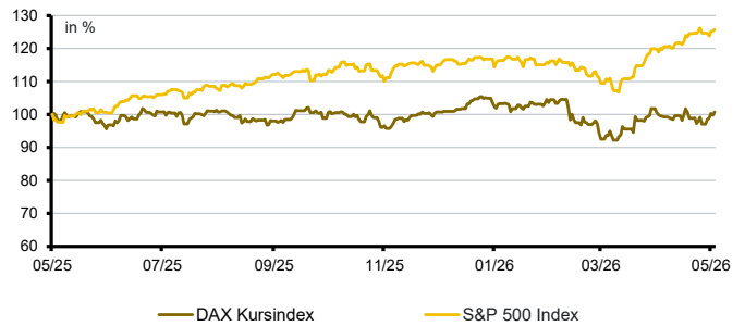
Aktien aktuell*: DAX Kursindex versus S&P500 Index

*Datenquelle der Grafik: Bloomberg; Darstellung von 12 Kalendermonaten; Entwicklung in lokaler Währung