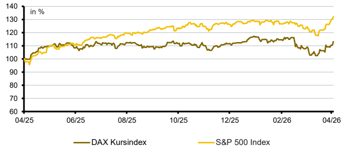
Aktien aktuell*: DAX Kursindex versus S&P500 Index

*Datenquelle der Grafik: Bloomberg; Darstellung von 12 Kalendermonaten; Entwicklung in lokaler Währung