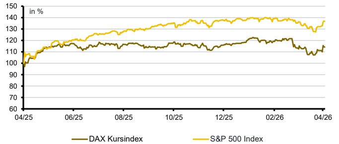
Aktien aktuell*: DAX Kursindex versus S&P500 Index

*Datenquelle der Grafik: Bloomberg; Darstellung von 12 Kalendermonaten; Entwicklung in lokaler Währung